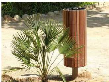
Rysunek 2. Rysunek poglądowy kosza na śmieci

Kosze kotwione na stałe do podłoża / wg systemu dostawcy.