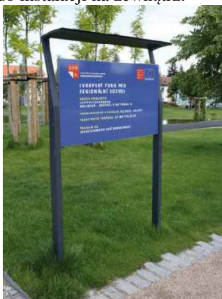
Rysunek 4. Rysunek poglądowy tablicy

Należy dokonać montażu tablic informacyjnych w formacie 100/80 o konstrukcji stalowej lub aluminiowej, np. PP firmy mncite lub innych równoważnych o wyglądzie zbliżonym do rysunku załączonego poniżej. Dobór należy konsultować z projektantem. Wszystkie elementy małej architektury powinny spełniać wymagania antywandalowe oraz być przystosowane do instalacji na zewnątrz.