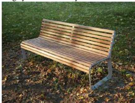
Rysunek 1. Rysunek poglądowy ławki

Ławki kotwione na stałe do podłoża / wg systemu dostawcy.