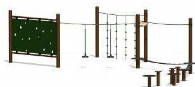
Rysunek 1. Przykładowa wizualizacja