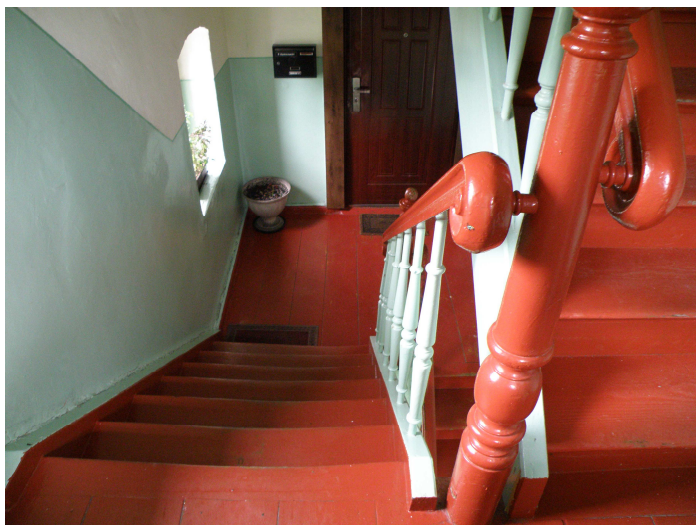
klatka schodowa drewniana