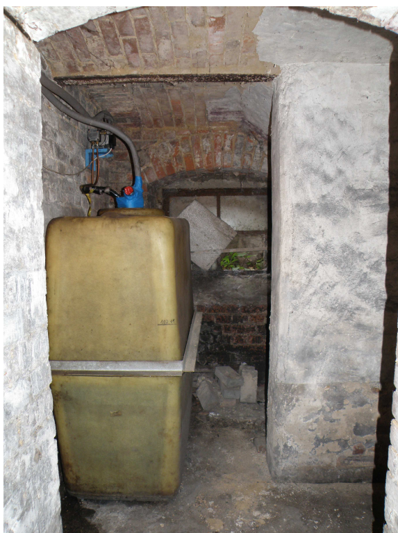
Zbiornik na olej w piwnicy