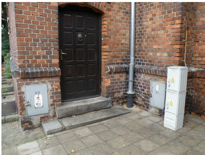
Drzwi wejściowe do cz. mieszkalnej