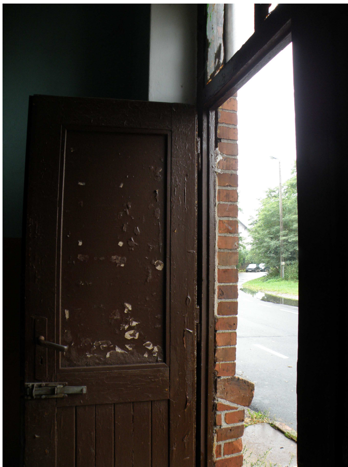
Wejście do budynku głównego