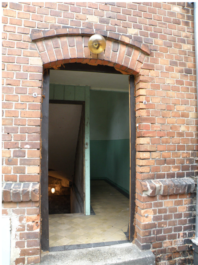
Drzwi wejściowe do cz. mieszkalnej