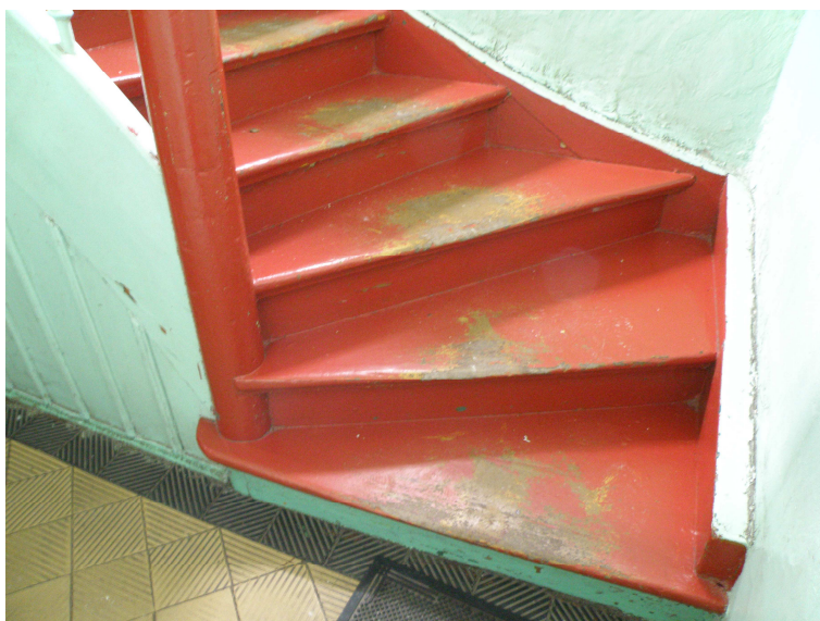
klatka schodowa wejście