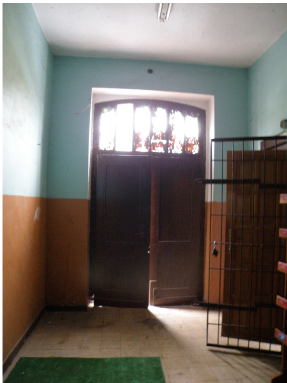
Holl budynku głównego