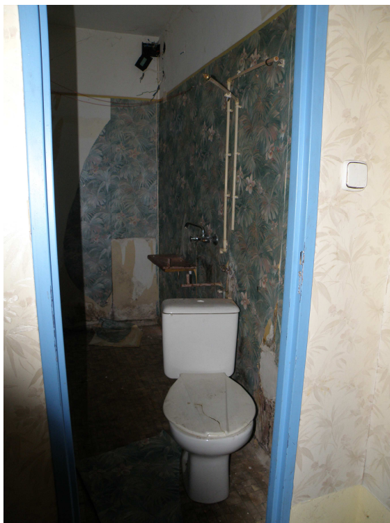
Łazienka cz. nieużytkowana