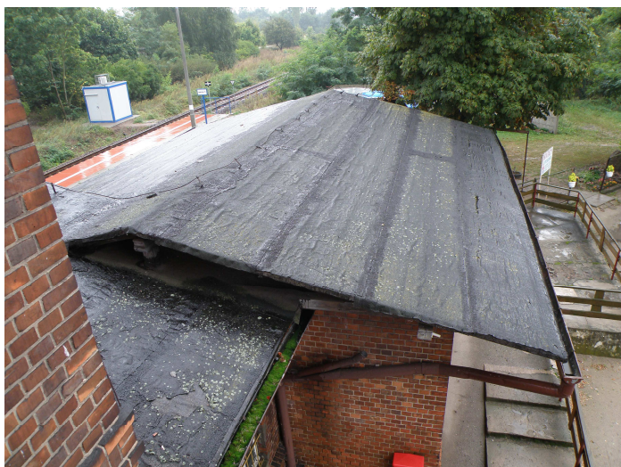
Widok na dach cz. magazynowej