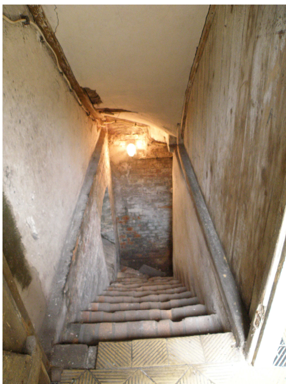
Schody do piwnicy