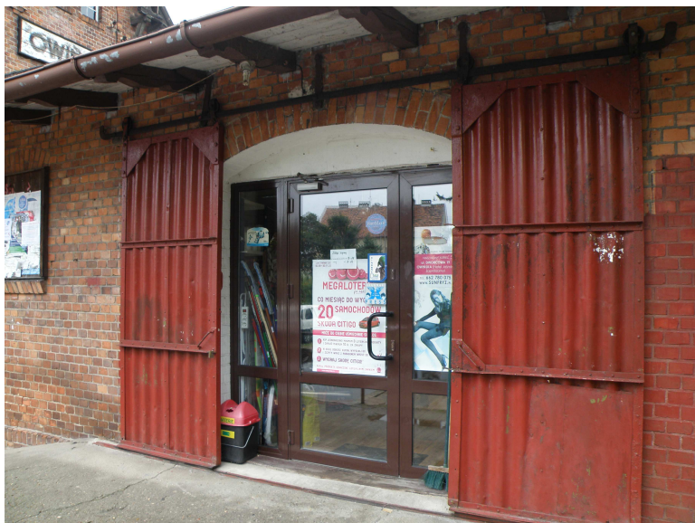
Drzwi do cz. Magazynowej - sklep