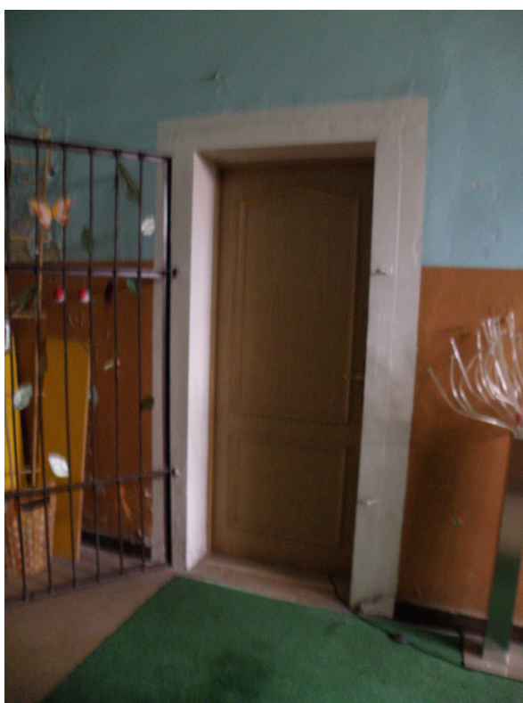
Wejście do pomieszczeń wynajmowanych (nauka j. angielskiego)